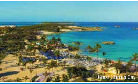
Great Stirrup Cay