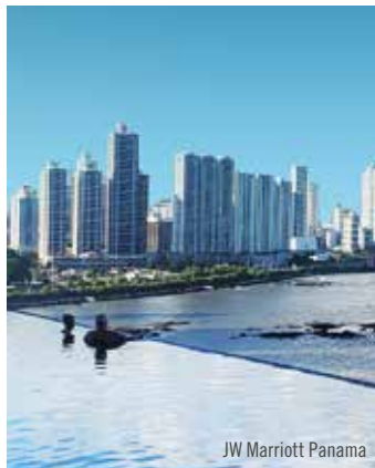
JW Marriott Panama