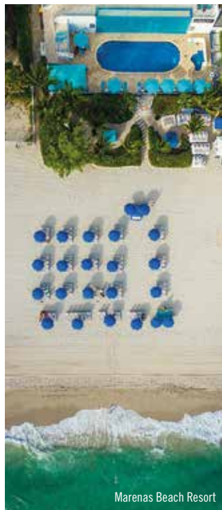
Marenas Beach Resort