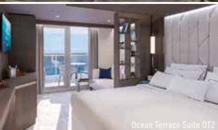
Ocean Terrace Suite OT2