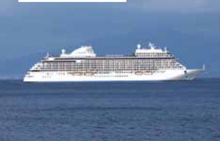
Seven Seas Explorer

Kreuzfahrtschiff der Luxusklasse + Baujahr 2016 + 366 Suiten + 6 Restaurants + Luxuriöse und elegante Einrichtung + Elegantes und modernes Schiff + Grosszügige Suiten mit Wohn- und Schlafbereich, begehbarem Kleiderschrank, edlem Badezimmer + Butler-Service in den Penthouse, Seven Seas, Explorer, Grand und Master Suiten