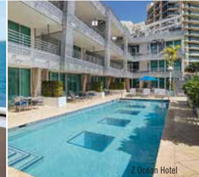
Z Ocean Hotel