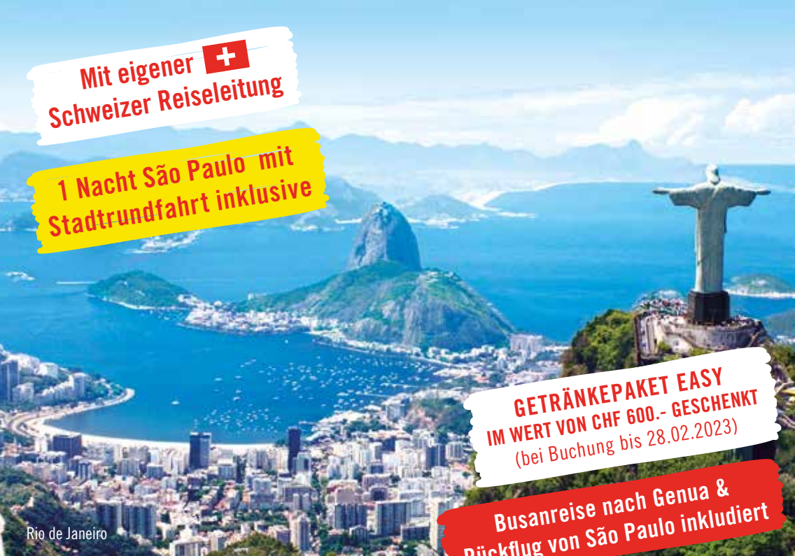
Rio de Janeiro

1 Nacht São Paulo mit Stadtrundfahrt inklusive