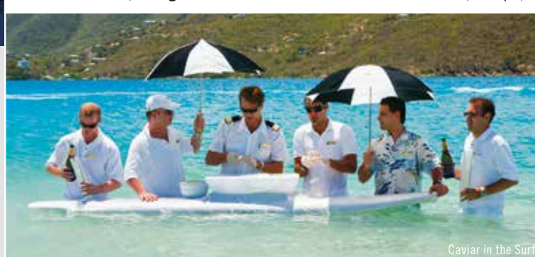
Caviar in the Surf

Ultra-Luxus-Schiff + Baujahr 2016 + 300 Suiten mit privater Veranda + Bad mit Doppelwaschbecken + persönliche Suite-Stewardess + 9 kulinarische Erlebnisse + 2 Pools, 6 Whirlpools + Wassersport-Marina + Tages-Events wie Champagner & Kaviar und Abendshows mit Weltklasse Künstlern + Fitnesscenter + Spa- und Wellnesserlebnis für "bewusstes Leben" + Waschsalon mit Selbstbedienung