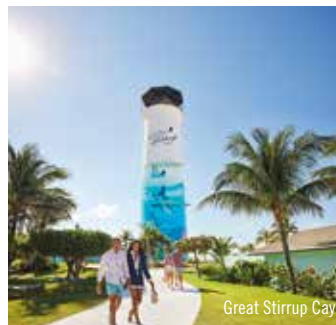
Great Stirrup Cay