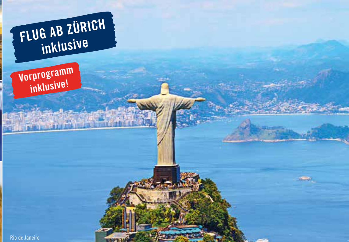
Rio de Janeiro