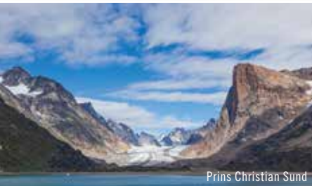
Prins Christian Sund