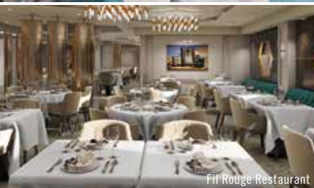
Fil Rouge Restaurant