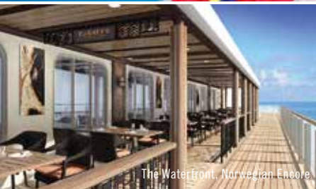
The Waterfront, Norwegian Encore